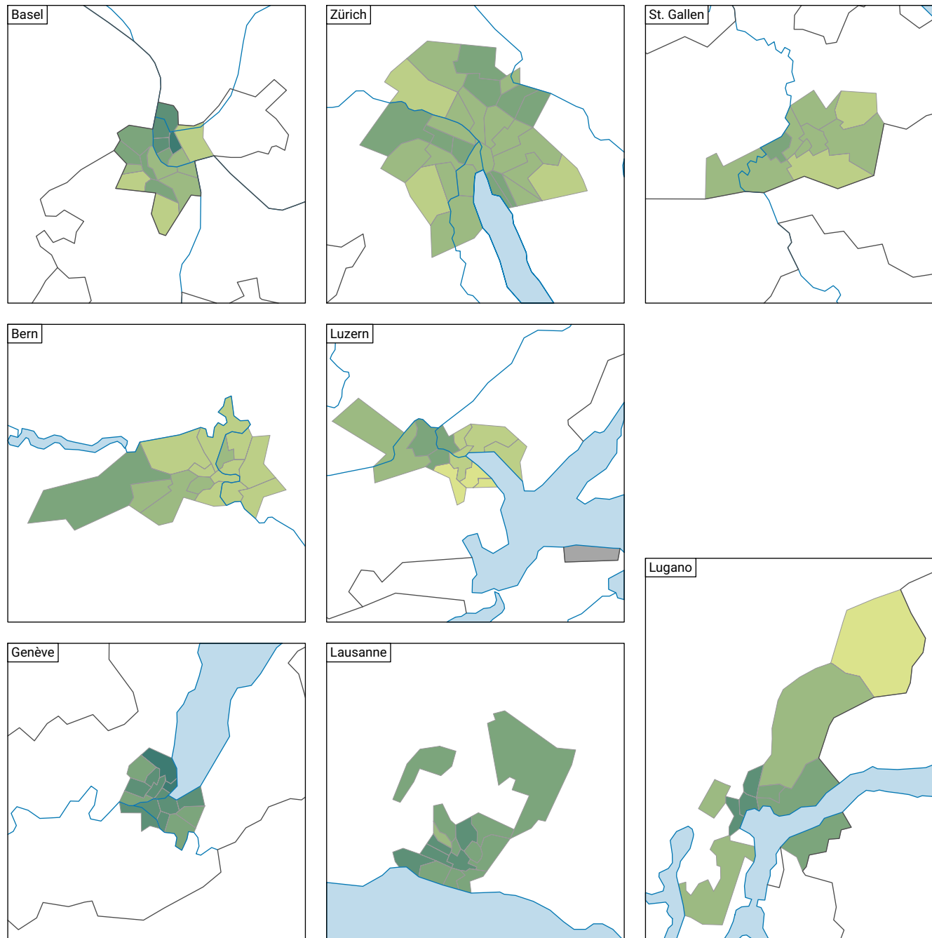
Part de la population résidente permanente étrangère dans la population résidente permanente totale*, en %